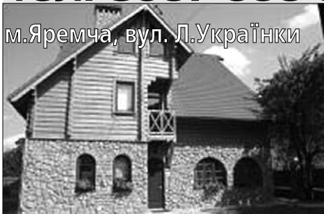
м.Яремча, вул. Л.Українки