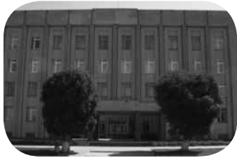
Красилівська міська рада

розвіднику, який героїчно загинув у чотирнадцять років та якому посмертно було присвоєно звання Героя Радянського Союзу. Далі, у рядочок, розташовуються колорит-