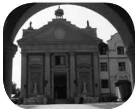
Римо-католицька парафія «Серця Ісуса» (сьогодення)