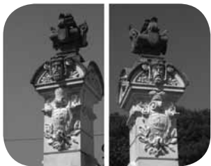
На колоннах зверху досі збереглися герби Потоцьких

тут після повернення графа Потоцького з африканського сафари, де під час полювання на нього напала левиця. Але мисливці, які були поряд, вистрелили у неї і врятували чоловіка. Трохи згодом, люди побачили, як до них йде маленьке левеня, яке потім Йозеф Потоцький привіз до свого палацу.